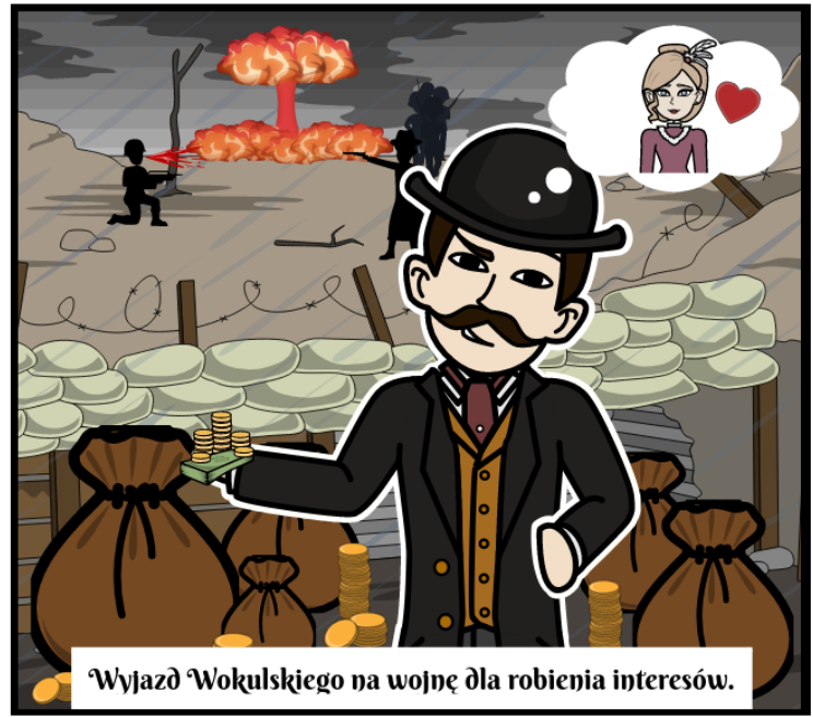
Wyjazd Wokulskiego na wojnę dla robienia interesów.