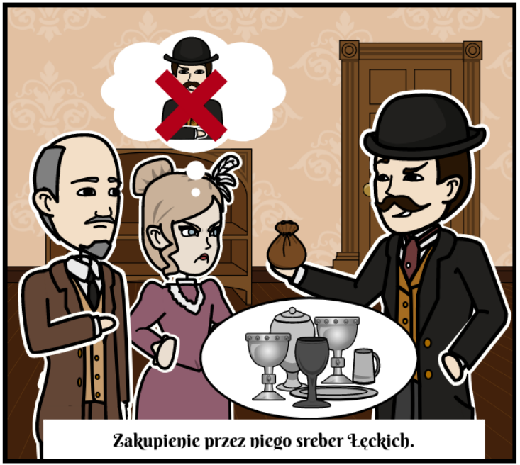
Zakupienie przez niego sreber Łęckich.