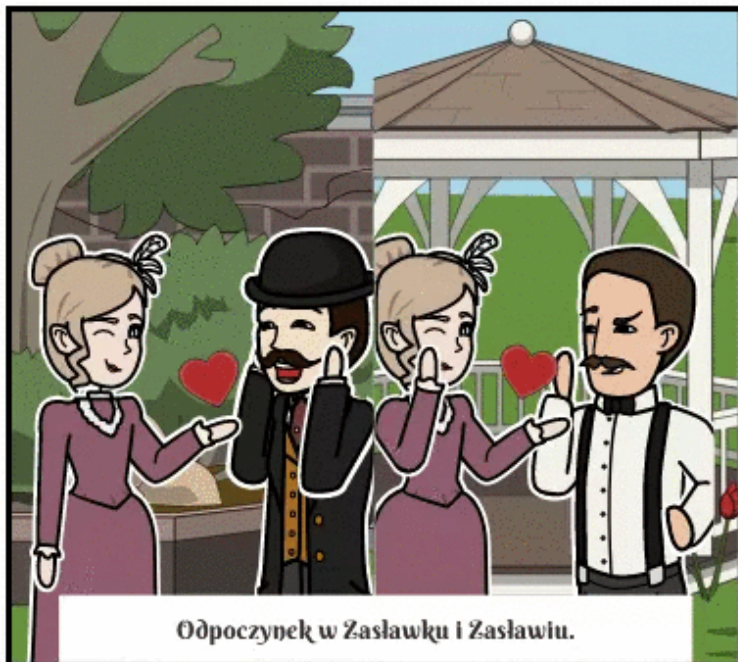
Ódpoczynek w Zaslawku i Zaslawiu.