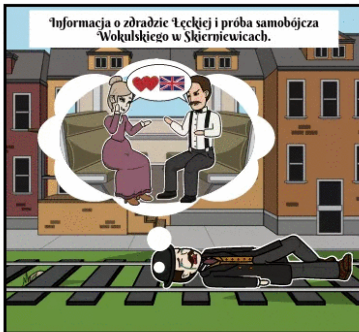
Informacja o zdradzie Łęckiej i próba samobójcza Wokulskiego w Skierniewicach.