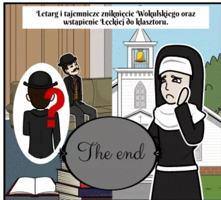
Łetarg i tajemnicze zniknięcie Wokulskiego oraz wstąpienie Łęckiej do klasztoru.