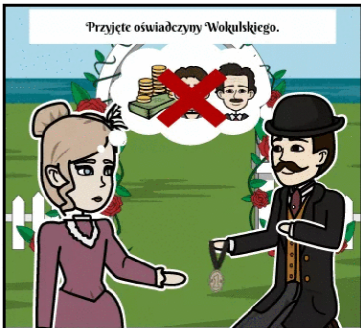
Przyjęte oświadczyzny Wokulskiego.