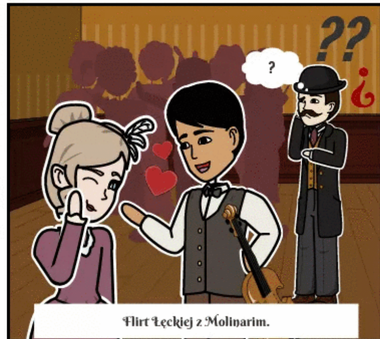
Flirt Łęckiej z Molinarim.